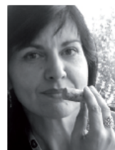
di Clara Mennella